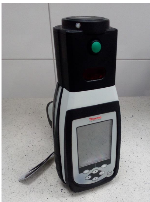
Obrázek 1 Přístroj MicroPhazir